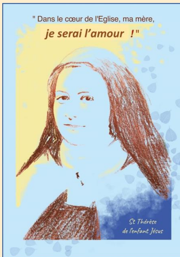
Ste Thérèse de l’Enfant Jésus et de la Sainte Face (Lisieux), fêtée le 1 er octobre Illustration d’Agnès Perruchon